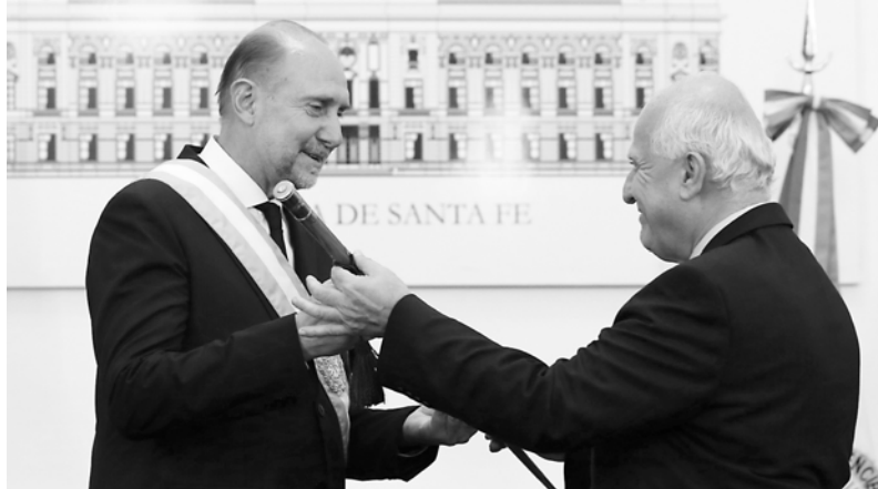
El peronista Perotti y el "socialista" Lifschitz. La provincia sigue inmersa en la violencia

La "solución" de Perotti fue designar como ministro de seguridad a Marcelo Saín, un supuesto "especialista" en temas de seguridad. Saín planteó "purgar" la policía de Santa Fe y solucionar el problema destituyendo a varios jefes policiales. Pero rápidamente se desató una nueva oleada de homicidios, que terminó