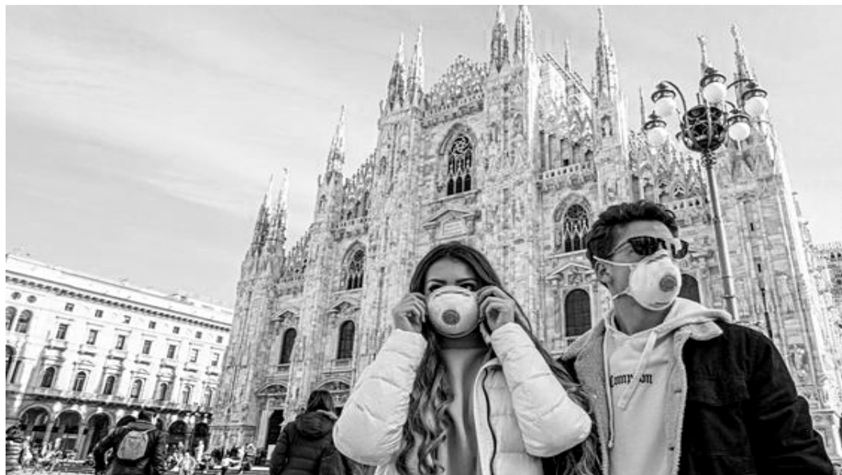
Milán, Italia. El coronavirus se ha extendido al norte de ese país

Pero la cuestión de fondo para los pueblos es ¿Porqué mueren cientos de miles por gripe? ¿Porqué resurgen enfermedades erradicadas como el cólera o el sarampión? ¿Porqué no se detiene la epidemia del ébola en África y surgen nuevos virus como el SAR y el coronavirus? Todo esto tiene que ver con lo que es el capitalismo: un sistema injusto, irracional y para los ricos. El caldo de cultivo del crecimiento de las enfermedades es la miseria creciente, el hacinamiento, los cambios ambientales y los sistemas de salud basados en la ganancia del