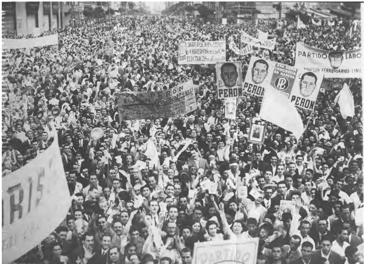
Una de las grandes movilizaciones de la campaña electoral del peronismo en 1946

Así se llegó al golpe gorila de 1955. Se forjó una alianza reaccionaria entre las patronales, el imperialismo y la Iglesia Católica. Tras hechos terroríficos, como el primer intento de golpe en el mes de junio, con bombardeos sobre la Plaza de Mayo, la clase trabajadora se radicalizó en defensa de Perón. Las movilizaciones y exigencias de "armas para el pueblo" se hicieron masivas. Sin embargo, cuando llegó el segundo y definitivo golpe, en setiembre, Perón decidió renunciar sin resistir. La propia CGT no movió un dedo. Miles de trabajadores, aislados y sin dirección aguantaron