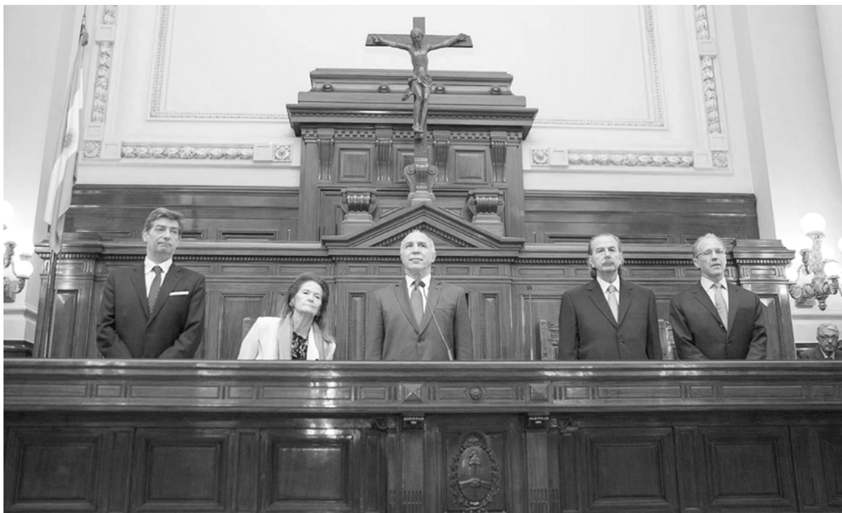
La Corte Suprema, embajadores, cónsules, ex presidentes y vice, obispos y arzobispos mantienen sus privilegios

En diciembre pasado el gobierno congeló la actualización de los haberes jubilatorios por medio de la ley de emergencia económica. Exceptuó de esa medida a las jubilaciones de privilegio que beneficia a los magistrados del Poder Judicial, fiscales, servicio exterior, ex presidentes y vicepresidentes y a la cúpula de la Iglesia Católica. El repudio se hizo sentir de inmediato. Por eso Alberto Fernández se vió obligado a anunciar que enviaría un proyecto para “corregir” la inequidad. Pero lo que siguió fue una autentica mentira.