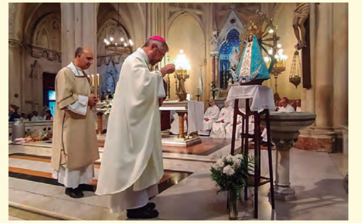
La jerarquía de la Iglesia contra los derechos de las mujeres

Con casi un mes de anticipación la cúpula de la Iglesia Católica está preparando una misa en la basílica de Luján para el domingo 8 de marzo, día internacional de las mujeres trabajadoras, con un claro objetivo: juntar a sus fieles y manifestarse en contra del derecho al aborto. La misa está convocada con un extraño lema: "Si a las mujeres, sí a la vida". En el marco de la jornada mundial de lucha por nuestros derechos, hay que repudiar esta nueva provocación clerical y reforzar nuestras movilizaciones feministas del 8 y el 9M en todo el país.