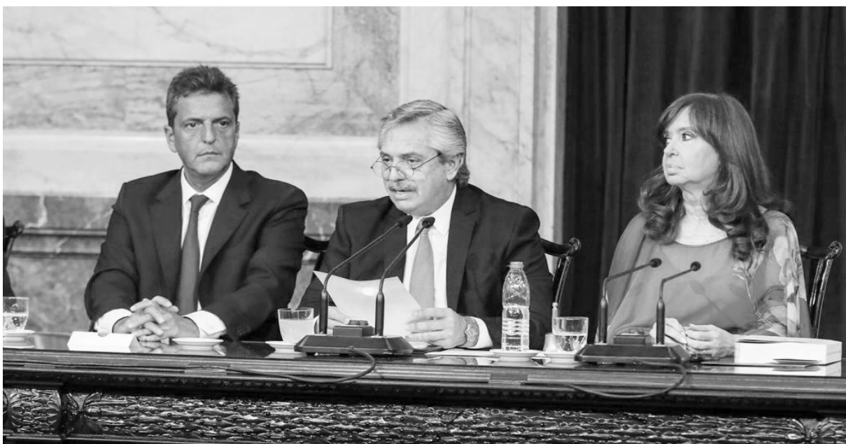
Alberto Fernández en la apertura de sesiones del Congreso, el 1° de marzo

El presidente inauguró las sesiones ordinarias. Tuvo a su lado a Cristina y a Sergio Massa. Pronunció un discurso de casi 10.000 palabras donde elogió al Papa, Alfonsín, Néstor Kichner, Belgrano y Perón. Si tras el saludo al “querido pueblo argentino”, algún trabajador o jubilado esperaba anuncios a su favor, se quedó con las expectativas.