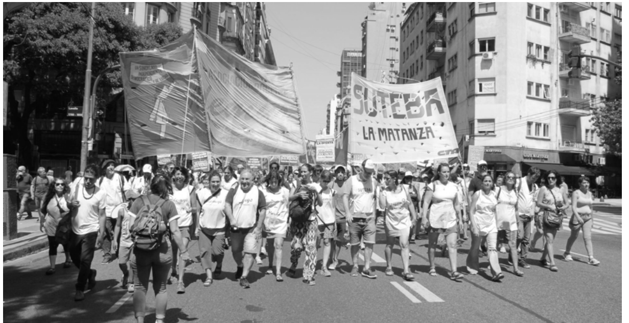
En la ciudad de Buenos Aires, una de las movilizaciones de los sindicatos combativos

La propuesta paritaria salarial nacional se oficializó sólo 4 días antes del inicio de clases y en las provincias fue después, pese a que desde febrero estamos en las escuelas. Es una propuesta vergonzosa: “sube” el piso salarial a la miseria de 23mil pesos, 1/3 de la canasta familiar (sólo 6 provincias tenían salario más bajo) y Nación entrega un bono de 1.250 pesos hasta julio. Los gobiernos provinciales “mejoraron” esa “oferta”: salvo Neuquén, en el resto sacaron la cláusula gatillo y propusieron bonos o aumentos entre 2000 a 4000 pesos hasta julio. O sea, se consolida la enorme pérdida salarial que tuvimos en 2019 con el macrismo y se ofrece un salario a la baja en 2020! Además, no hay mejora real en construcción de aulas y escuelas, obras sociales y demás necesidades. Mientras, Fernández, Kicillof y los gobernadores, no dudaron en pagar cash millones a